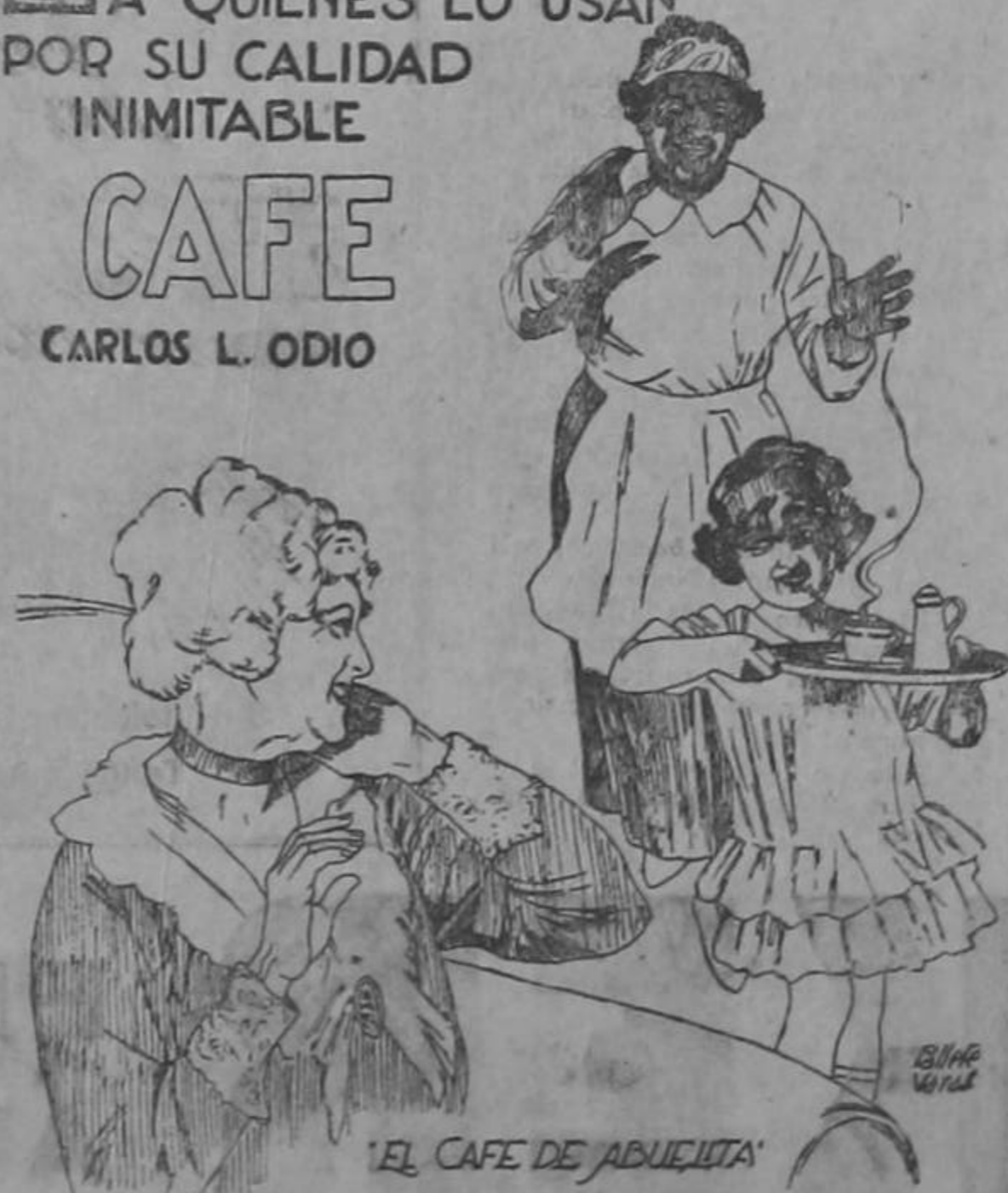
'EL CAFE DE ABUELA'